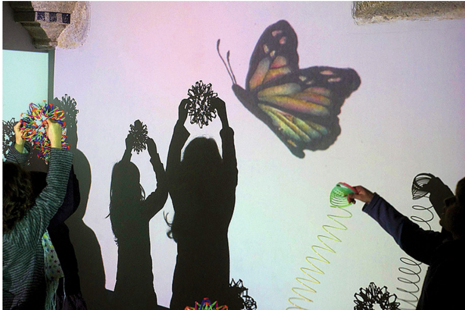
Imaginación al poder en el taller de Createctura.